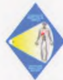
Общество радиологов Узбекистана